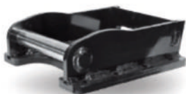
Sistema di aggancio rapido