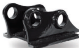
Sistema di aggancio standard con perni